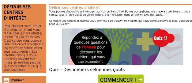
Figure 3 : Accès au questionnaire d'intérêts professionnels.

- Cliquez ensuite sur « Commencer » (figure 3) pour répondre aux questions posées (jusqu'à trois réponses possibles par page de questions avec 11 pages de questions au total).