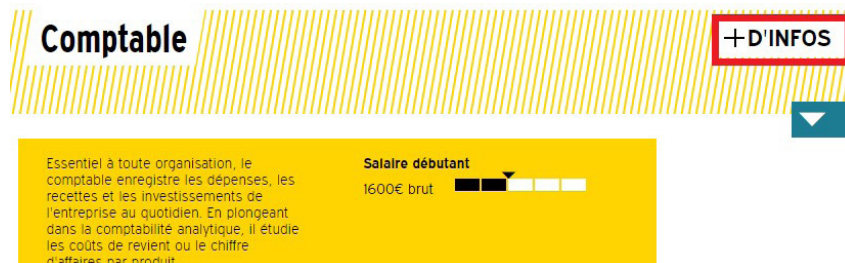
Figure 7 : Navigation entre la fiche métier simplifiée et complète.