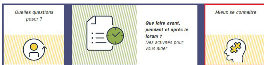
Figure 2 : Accès au questionnaire d'intérêts professionnels depuis le kit salons et forums.

- Cliquez ensuite sur « Commencer » (figure 3) pour répondre aux questions posées (jusqu'à trois réponses possibles par page de questions avec 11 pages de questions au total).